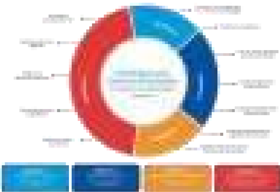
Figura 1. Esquema del Perfil de egreso de la Formación Inicial Docente

El Perfil de egreso incorpora competencias vinculadas a la formación integral que requieren los docentes en el siglo XXI. Estas son de naturaleza transversal a las competencias profesionales docentes presentadas en el MBDD. Son esenciales para la construcción de la profesionalidad e identidad docente en la FID. Para efectos de organización y coherencia del Perfil de egreso, éstas se incluyen en el dominio 4 establecido en el MBDD, al que se le ha agregado el término “personal”. Tales competencias se orientan al fortalecimiento del desarrollo personal, a la gestión de entornos digitales y al manejo de habilidades investigativas que le permitan reflexionar y tomar decisiones para mejorar su práctica pedagógica con base en evidencias.